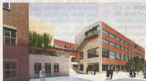
Neu Asymetrische Formen und ein nebeneinander von Arbeitsplätzen und Ruhezeiten sind das Konzept.

TV-Firmen ein. Im Galeriehaus werden es Kunstbetriebe und Galerien sein, im Kontorhaus etliche Büros für Werbeagenturen oder auch Handelsfirmen. Für den kom-