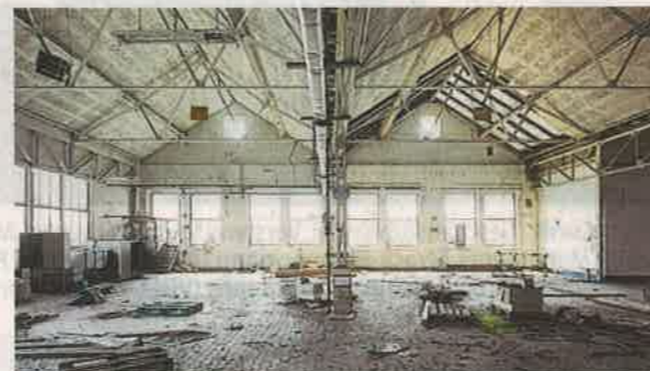
Alt Die imposanten Werkshallen sind völlig entkernt worden und werden jetzt saniert.