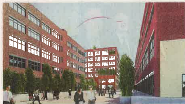
Neu Der zentrale Platz in der Mitte des Quartiers wird Begegnungspunkt werden.

Doch passende Mieterstrukturen, die sich gegenseitig ergänzen, sind das eine. Die wirtschaftlichen Rahmenbedingungen müssen erstmal stimmen. Die Schwanenhöfe bestehen aus den alten Industriehallen- und Gebäuden, die die Macher auf ihre optimale Nutzung nach einer Sanierung ergründet haben. Die Namen der Gebäude spiegeln heute zum Teil das Ergebnis wider: Im Theaterhaus mieten sich Kultureinrichtungen, Film- und