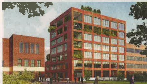
Neu Das „Grüne Haus“ sollte eigentlich mehr Bäume beherbergen. Es wird jetzt in einer abgespeckten Version gebaut.