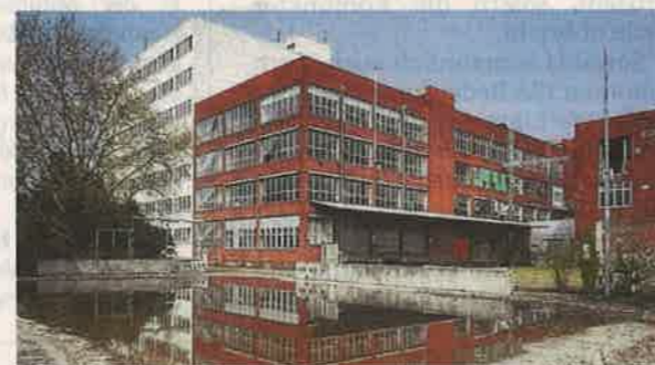
Alt Das „Galeriehaus“ hat 7100 Quadratmeter Fläche auf fünf Ebenen.

samt zehn renovierten Gebäudekomplexe einziehen. Der Clou: Die Auswahl durch Walten und seine beiden Partner ist hart. Es geht nicht um einen möglichst hohen